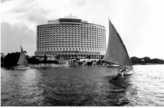
أسامة سلطان/جامعة ميديري