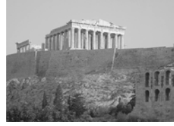
أسامة سلطان/جامعة ميلبوري