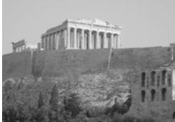
أسامة سلطان/جامعة ميلبوري