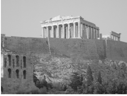
أسامة سلطان/جامعة ميلبوري